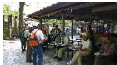
銭洗弁財天で説明聞く

て折つた。人々もこれに習つて銭だけでなく、金銀財宝や証書までこの水で洗い清めるようになった。その霊験があらたかだつたので、いつとはなしに銭洗いの水と呼ぶようになり、鎌倉五名水の一つになり、巳の縁日には参拝者が非常に多くなつた。弁天のご神体の宇賀福神は水の中で、体は蛇、頭は老人の形をしているそうである。