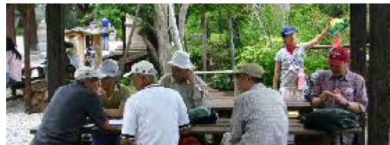
藤棚の下で昼食休憩