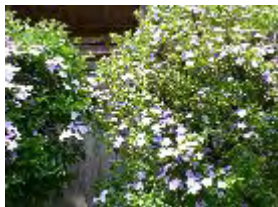
ニオイバンマツリ