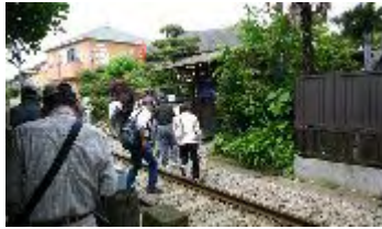
駅の横、線路を横断