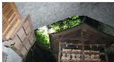
洞窟の中天井は空が見える