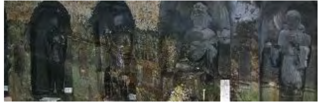
弁財窟の暗闇にある十六童子(弘法大師の作らしい)