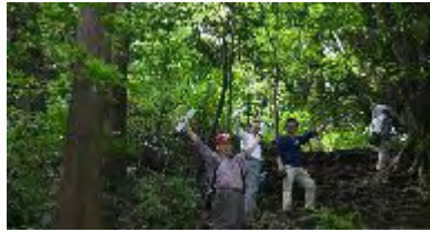
急な坂道木の根っこが頼り