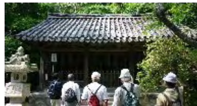
朝鮮様式の屋根瓦の建物