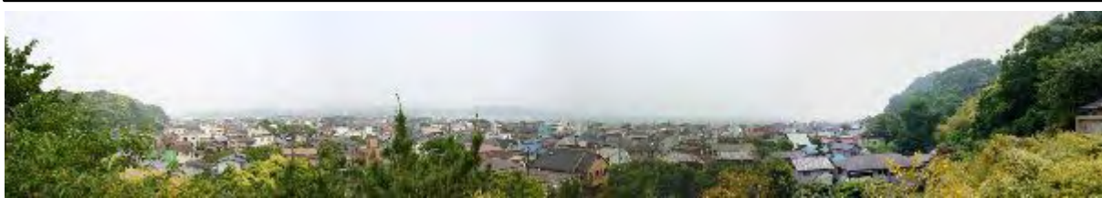
長谷寺からの展望