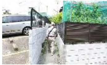
こんな路地を通して