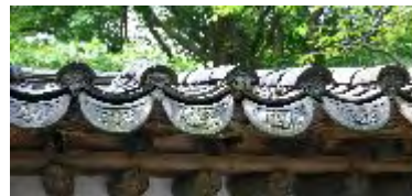
大仏の裏手にある建物 屋根瓦に朝鮮の様式

物の瓦が気になった。雨樋が無く瓦が斜めに取り付けられている。朝鮮に行くときほとんどがこのような瓦屋根だそう。