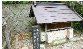
北條時宗公産湯の井

盛長は、源頼朝が旗揚げする前からの下臣で、石橋山の合戦に頼朝が敗れて房州に逃れた時も一緒だった。頼朝が鎌倉に居を構えたとき、西の押さえとしてこの地甘繩に屋敷を与えられた。鎌倉幕府の樹立に尽力し頼朝に重用され、頼朝・政子が甘繩神明宮に参詣した折にはこの屋敷に立ち寄った。頼朝亡き後頼家の時代十三人の合議制のメンバーにも