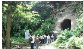
日朗が入られた土牢